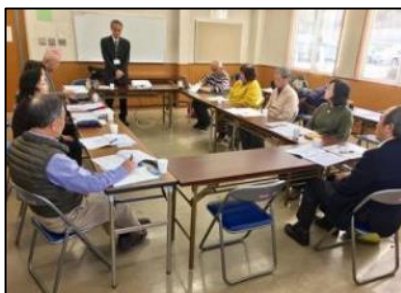
ワーカー交流会風景

平成29年2月15日、コミュニティセンター治田東にて「ワーカー交流会」を開催しました。今回は実際に長期間に渡って支援されている「草津第二むつみ園」、「県・引きこもり支援センター」「ひだまりの家」のワーカーの方に集まいただきました。ワーカーの皆様からプロボノ活動の基本となるお話を聞くことができました。「利用者の方の自立を促すために、それぞれの距離感を持って接する」「出来る目標を定めて、やり切ることを積み重ねる」「利用者の方の作品に対して、共に感動して、悦び、豊かなものにする」などです。そのためには準備を怠らず、また「様々な問題に対しては支援先、利用者、ワーカーと一緒に考えることが大事です」とも言われました。今後のプロボノ活動に対しての見識と活力をいただいた交流会でした。