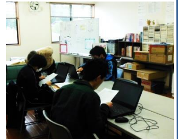
エクセルソフトを使い桜の開花予想をしている様子

園では今後、近くの畑での野菜作りを計画されています。作る、育てる喜びとそれを収穫してみんなでいただく楽しみにつなげていき、最終的には商品化が出来ればと夢が広がっています。ここにもプロボノ滋賀のワーカーが参画する予定です。