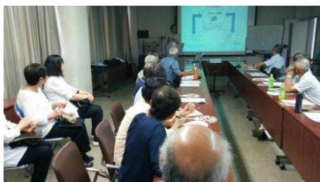
説明する今道理事

交流会ではプロボノ滋賀の紹介に続き、「よしの音」グループによる、ギターとよし笛の演奏が行われ、参加された皆さんは爽やかな笛の音色にうっとりさせられていました。その後コヒータイムとなり参加者同士の交流の場も持たれました。