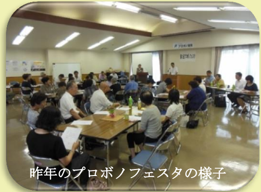
昨年プロボノフェスタの様子